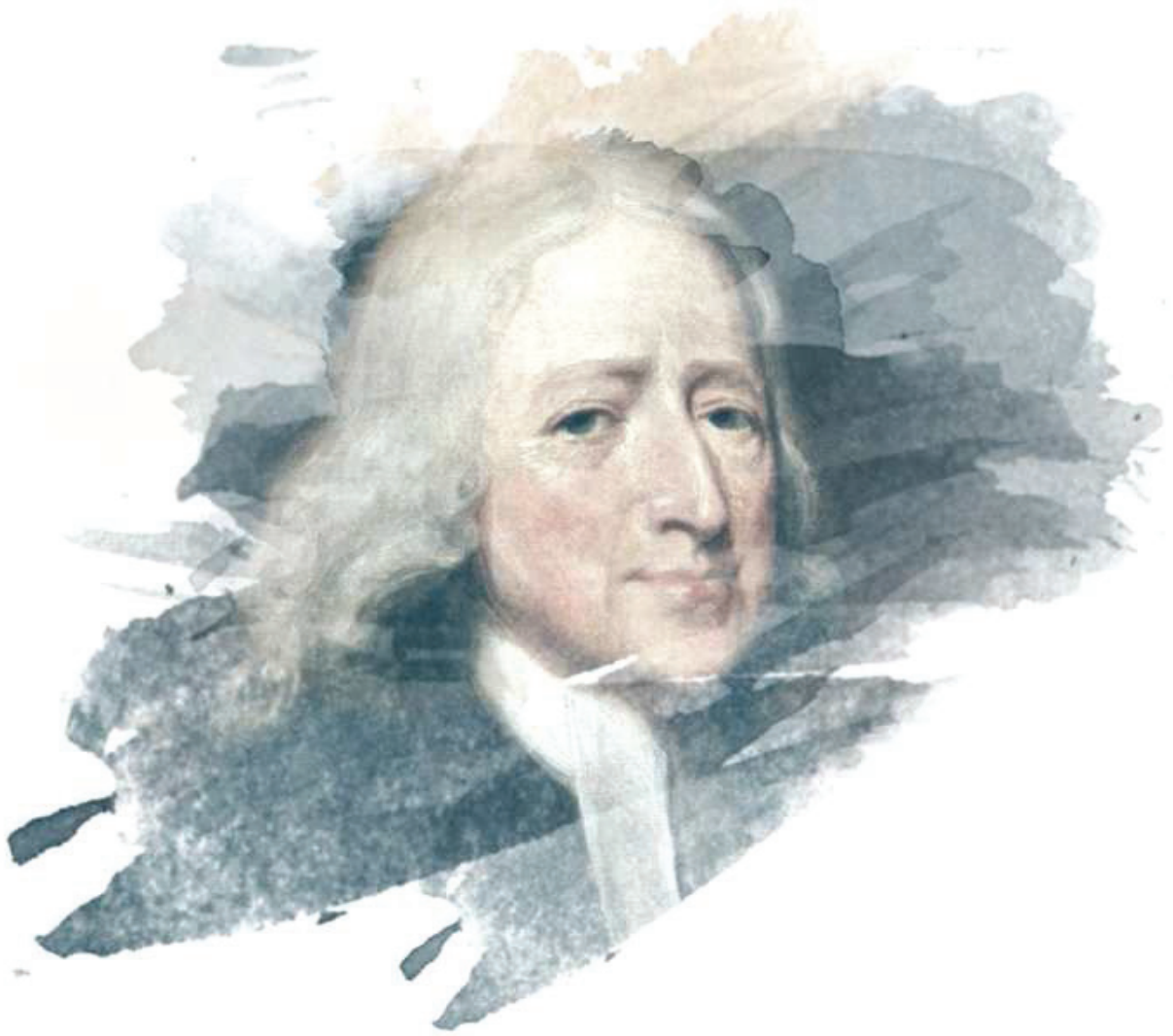
John Wesley, 1703-1791 Founder of Methodist Movement