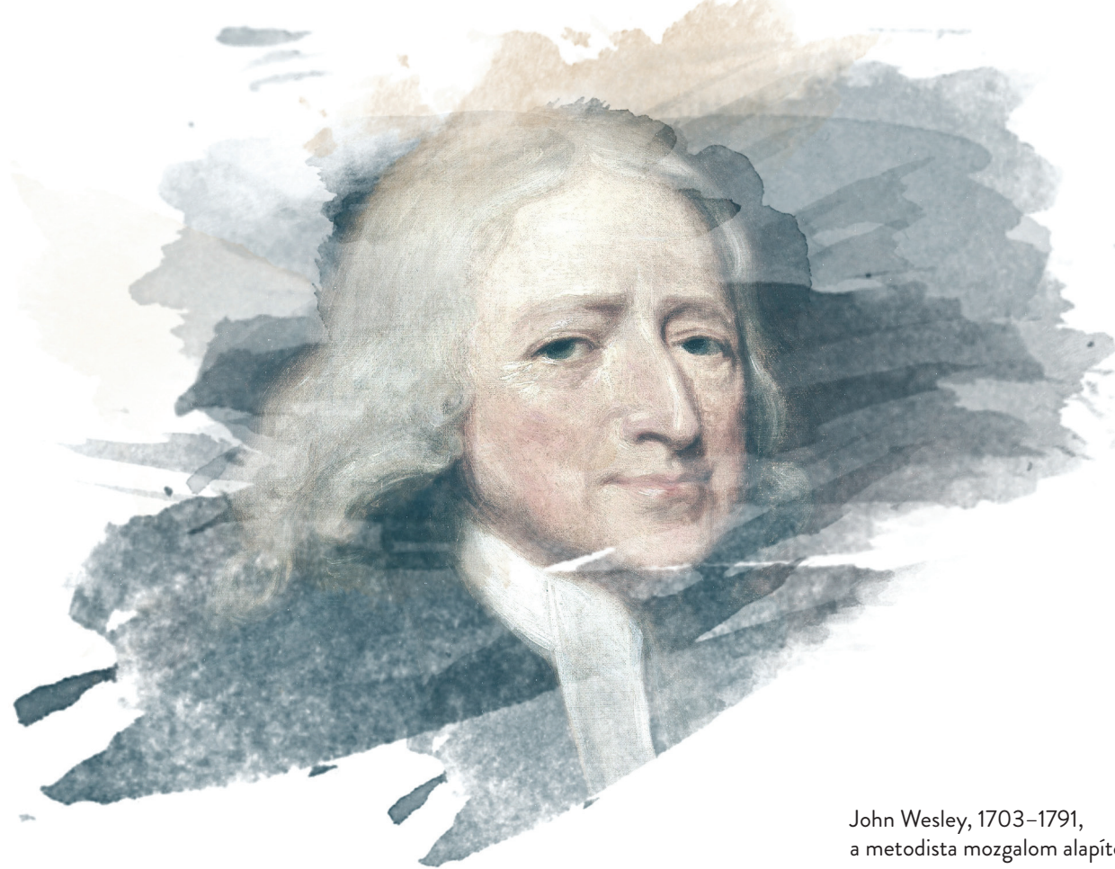
John Wesley, 1703–1791, a metodista mozgalom alapítója.