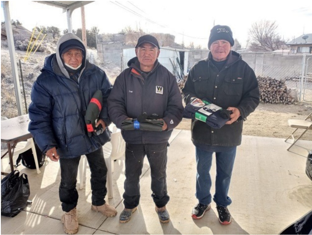
Distribución de ropa y provisiones en la comunidad de Gallup

Además de ministrar a los ancianos, realiza estudios bíblicos con las mujeres de la reserva. Gracias a su conexión y a su fidelidad al servir a las mujeres y los ancianos, ahora los hombres de la reserva la invitan para que enseñe estudios bíblicos en las cabañas de ceremonia para hombres.