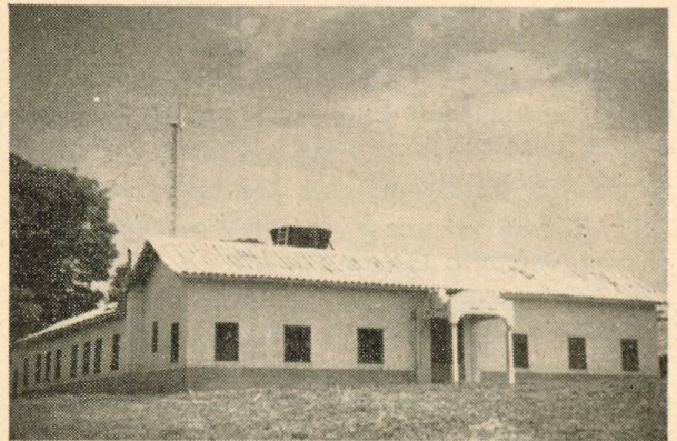
Edificio de la Es- cuela Bíblica en San Jorge Rivas, Nicaragua.