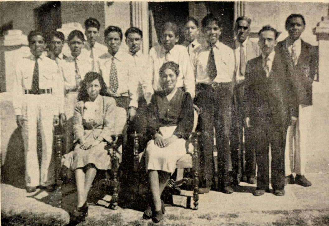
Alumnos de la Facultad de la Escuela Bíblica en el Distrito Norte de México.