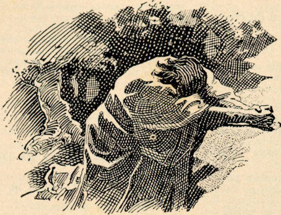
Jesús en Getsemaní

Hombres y mujeres han pasado por grandes sufrimientos mentales y por grande agonía de alma, pero nadie ha sufrido lo que sufrió nuestro Señor Jesucristo en Getsemaní. Jesús oró en aquella noche triste mientras dormían los once discípulos, mientras los sacerdotes esperaban en la corte de Caifás para condenar a muerte a Cristo, mientras el traidor Judas venía para entregarle y los soldados venían a llevarle.