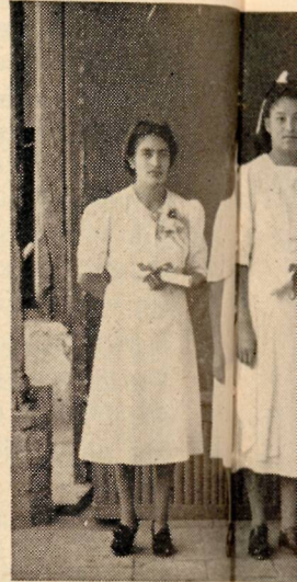
Alumnas Graduadas Instituto G. C. A.