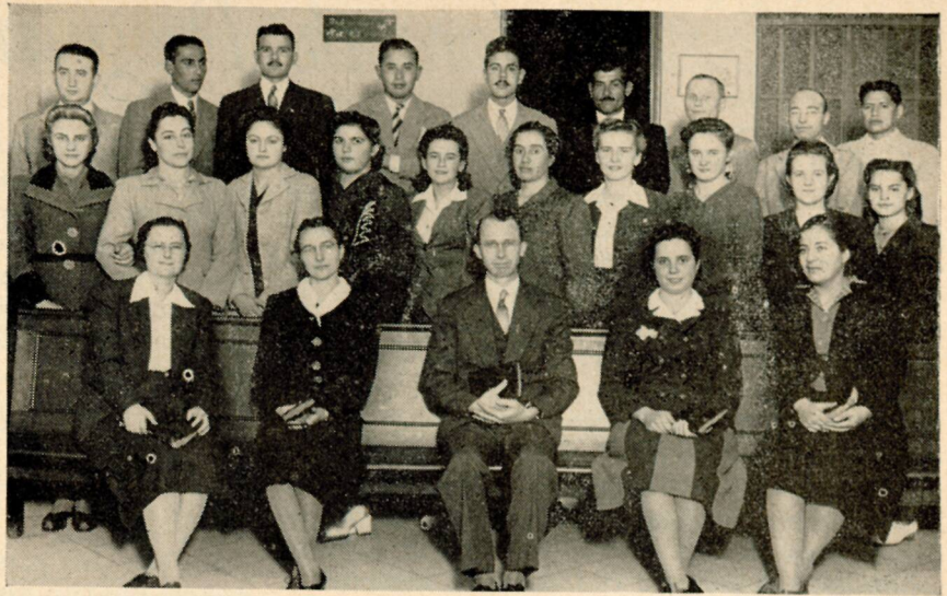
Facultad y Alumnos del Instituto Bíblico en Buenos Aires, Argentina