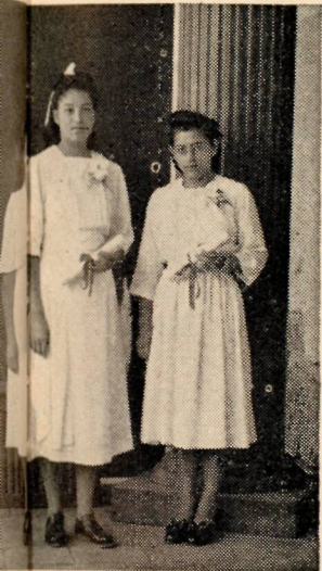
... Instituto Bíblico de Cobán, Guatemala, C. A.