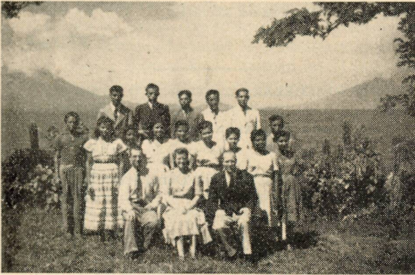
Facultad y Alumnos de la Escuela Bíblica en Nicaragua, C. A.