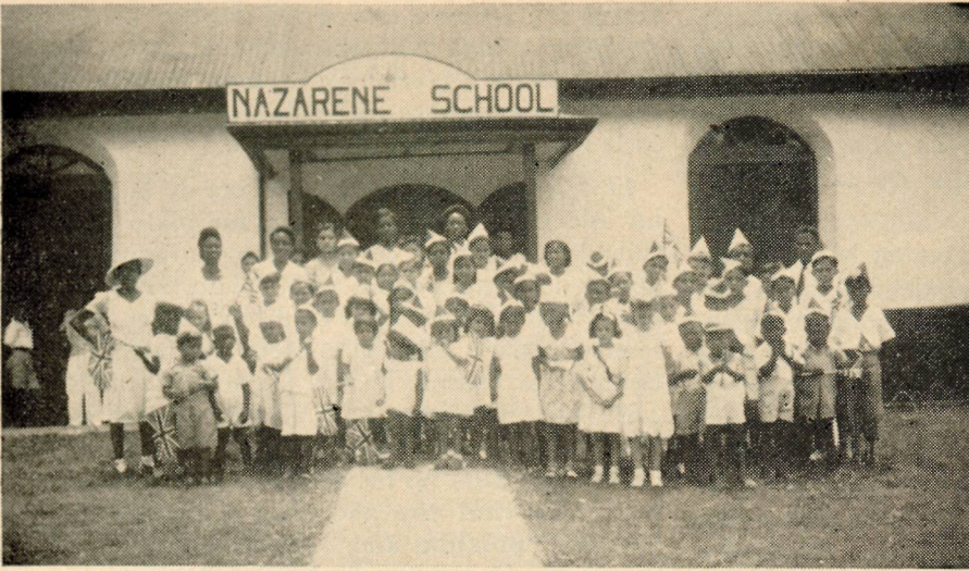
Escuela Diaria en Honduras Británica